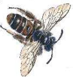
Vaddsandbi Andrena flavipes