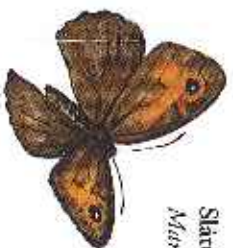
Slättingästfjäril Mariposa jurtina

Ytterligare information om Åskhult och stigarnas stationer finns att läsa i skriften Åskhults historiska stigar .