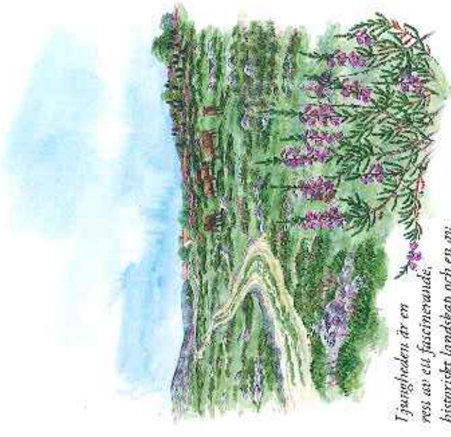
Ljungen är en res av en fascinerande, historiskt landskap och en av Europas mest hotade naturtyper.

En stor del av skogen har under senare år avverkat för att ge plats åt en öppen ljung. I ljungens betas på nytt och i maj 2006 genomfördes den första ljungbränningen i modern tid i Åskhult. Ljungbränning är en gammal metod som traditionellt sett har använts för att förnygra ljungen och förbättra betet.