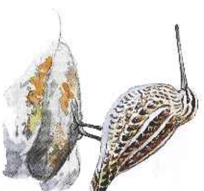
Finkbeckasin Callinago gallinago

Betande djur Observera att stigarna delvis går genom hagar med betande djur. Djuren är vana vid att det rör sig människor i markerna men visa hänsyn. Ta det lugnt i deras marker, var inte närgångna och mata inte djuren. Hundar och andra husdjur ska hållas i koppel.