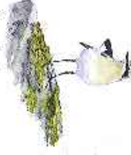
Stenskvätta Oenanthe isabellina

Åskhult är en unika bevarad bymiljö som ger en god bild av hur många västsvenska byar såg ut för 200 år sedan. Sedan 2004 har Åskhult och omgivande marker varit skyddade som kulturresevat. I resevatet återstapats successivt ett närmast muscalt och småskaligt kulturlandskap med små åkrar, odlingsrösen och slätterängar. Stora arealer planterade granskogar har avverkas för att ge plats åt ett öppet, betat ljungedalslandskap. Välkommen att vandra längs stigarna i Åskhult men visa alltid hänsyn till människor, djur och natur. Var uppmärksam på att särskilda föreskrifter gäller i resevatet.