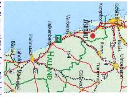
Från flyttug en till Fjärdsöfjärden, till skyddad väg till Åskhult via Gullinge, totalt ca 1,4 mil.

Gruppbokning maj-september, var god kontakta oss.