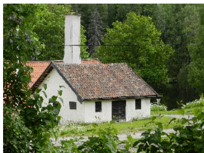
Utsikt från Caféet mot gnisterhus, hammar- smedja och fångdammen.