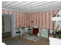
Köket i smedbostaden grålus.