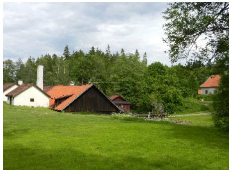
Klensmedja, gnisthus, hammarsmedja, såg och förvaltarbostad.