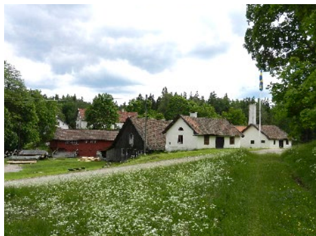
Brukskontoret, förvaltarbostaden, hammarsmedjan, klensmedjan och gnisthuset.