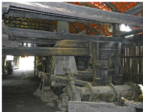
Räckhammare av 1600-1700-talskonstruktion. Den enda bevarade i Skandinavien.

Övre Häfla Bruk är en av Sveriges bäst bevarade industrimiljöer med flera unika föremål bland annat en stångjärnshammare och en tyskhärd. Bruket är ett industriellt minnesmärke över svensk järnhantering och bjuder besökaren på en unik upplevelse av svensk industrihistoria och människors vardag från 1600-talet fram till 1900-talet.