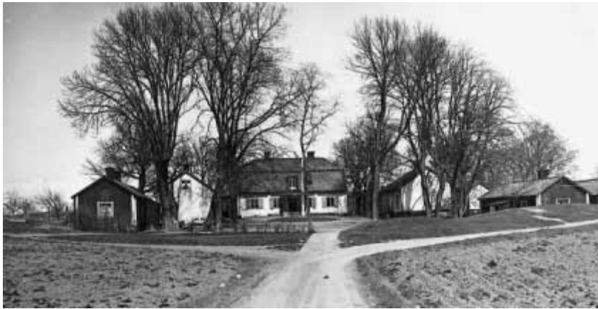
16. Ekholmsnäs gård hade ursprungligen dubbla flyglar.