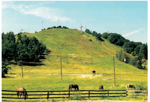
15. Ekholmsnäsbacken är 70 meter hög.