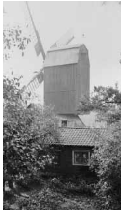
4. Näsets kvarn och kvarnstugan