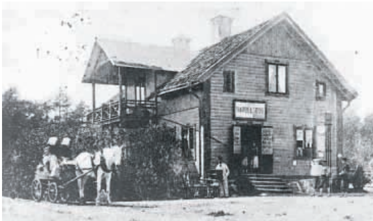
1. Nynäs, Lidingös första handelsbod.