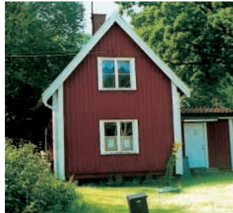
7. Kaptensstugan beboddes av ångbåtskaptenen Jansson med familj.